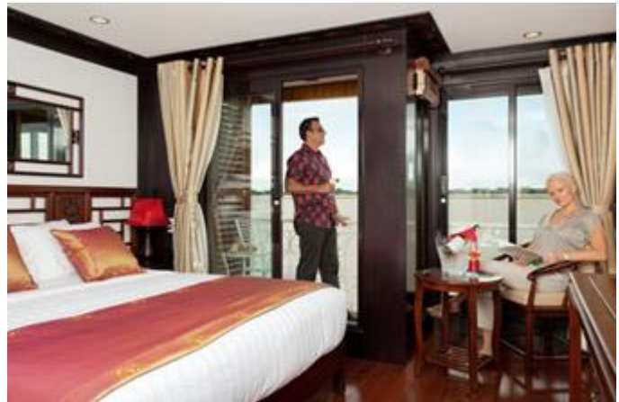
CAT. B : Balkonlu Kabin , 21 m 2