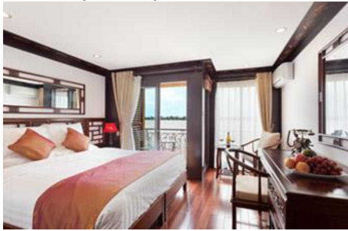
CAT. A : Balkonlu Kabin , 21 m 2

*Dünyadaki petrol krizinden ötürü artan petrol fiyatları yüzünden tüm uluslar arası uçuş yapan IATA statüsündeki havayolları bu artışları fuel surcharge adı altında yolcularından talep etmektedir. Günden güne değişen petrol varil fiyatları maalesef siz sayın yolcularımıza zamlı olarak yansıtılmaktadır. Havalimanı vergisi adı altında sizlerden tahsil edilen fuel surcharge adı altındaki fark tamamen havayollarına ödenen net rakamlardan ibarettir. Bu konuda Golden Bay Tour'un herhangi bir kazancı söz konusu değildir. Havayolunun biletine gelecek vergi, sigorta vb artışlar aynı oranda misafirlerimize yansıtılacaktır.